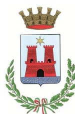
Castel di Sangro