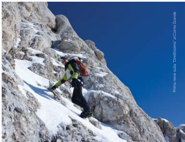
Prima neve sulla "Direttissima" al Corno Grande