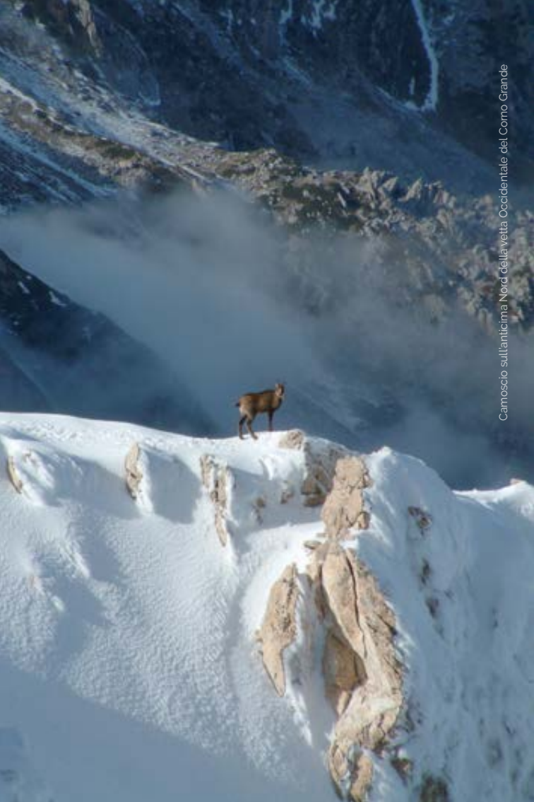
Camoscio sull'anticima Nord della vetta Occidentale del Corno Grande