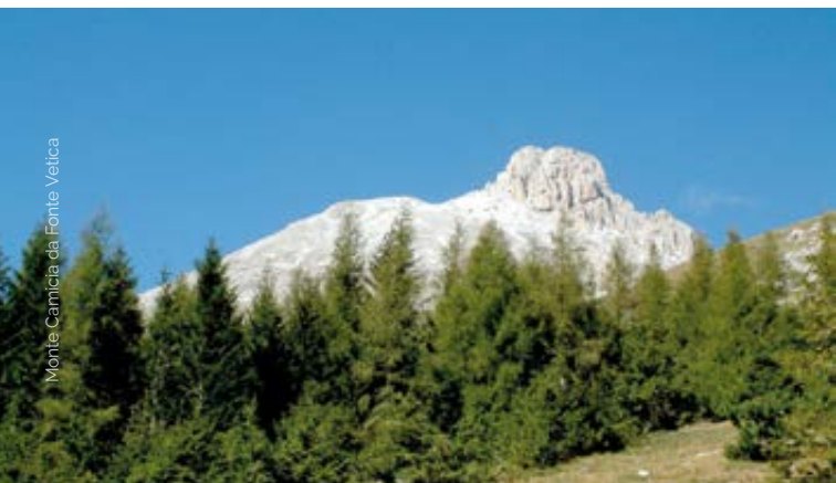
Monte Camiccia da Fonte Vetica