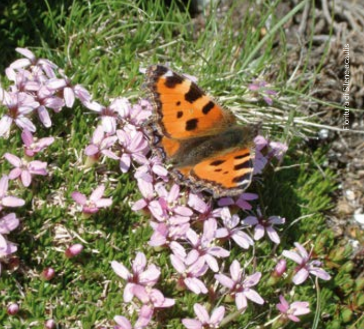
Floritura di Silene acaulis