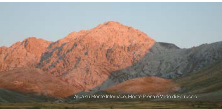
Alba su Monte Infornace, Monte Prena e Vado di Ferruccio

La data potrà subire variazioni in relazione alle esigenze del Comitato Perdonanza del Comune dell'Aquila